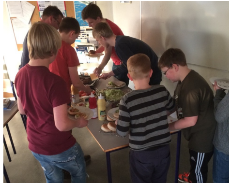
Det kan ikke gå hurtigt nok med at få noget at spise, når man har arbejdet med joller hele aftenen.