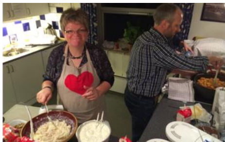
Godt gang i køkkenet for at bespise 50 mennesker med hjemmelavet julefrokostmad