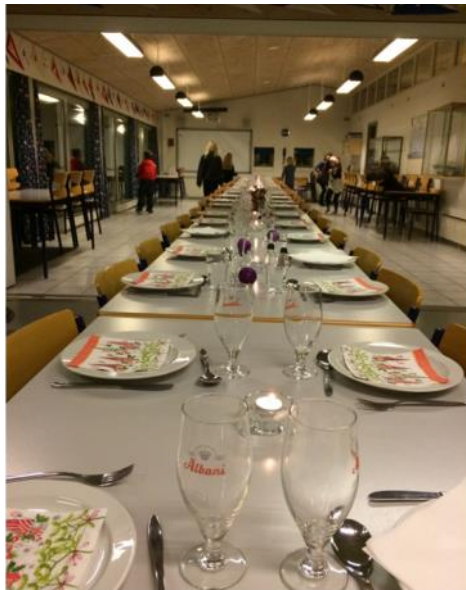
Årets bord gik på tværs af begge lokaler, for at vi kunne være der