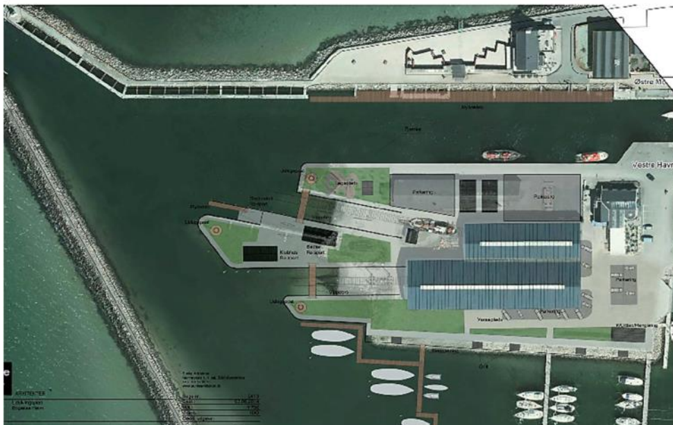
Projekt Nord for Værftet

Den 25. september 2014 blev der holdt stiftende generalforsamling i foreningen Bogense Havn Maritime Laug. Forkortet BHML. Ifølge vedtægterne for BHML er formålet for foreningen: At løse opgaver af fælles interesse for Bogense Havn.