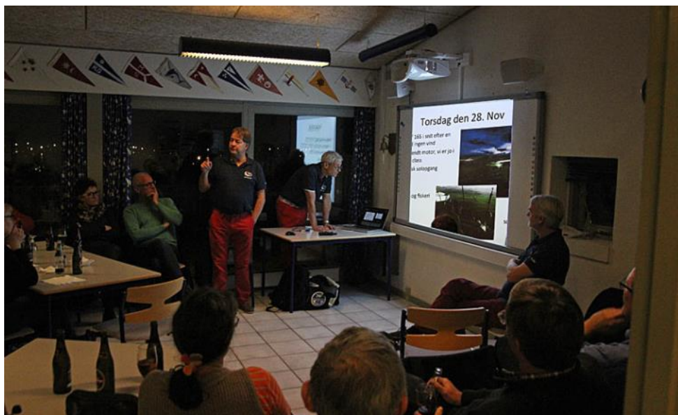
...og sætte showet i gang...