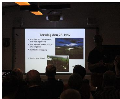
Der blev lyttet intenst...