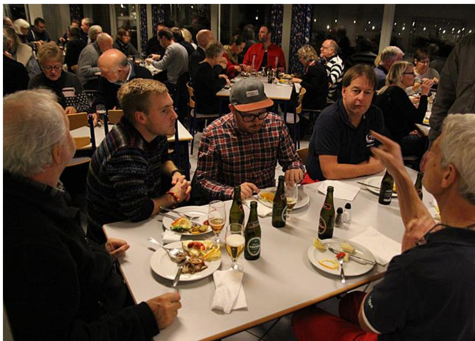
Det virkede som om at menuen var god.....