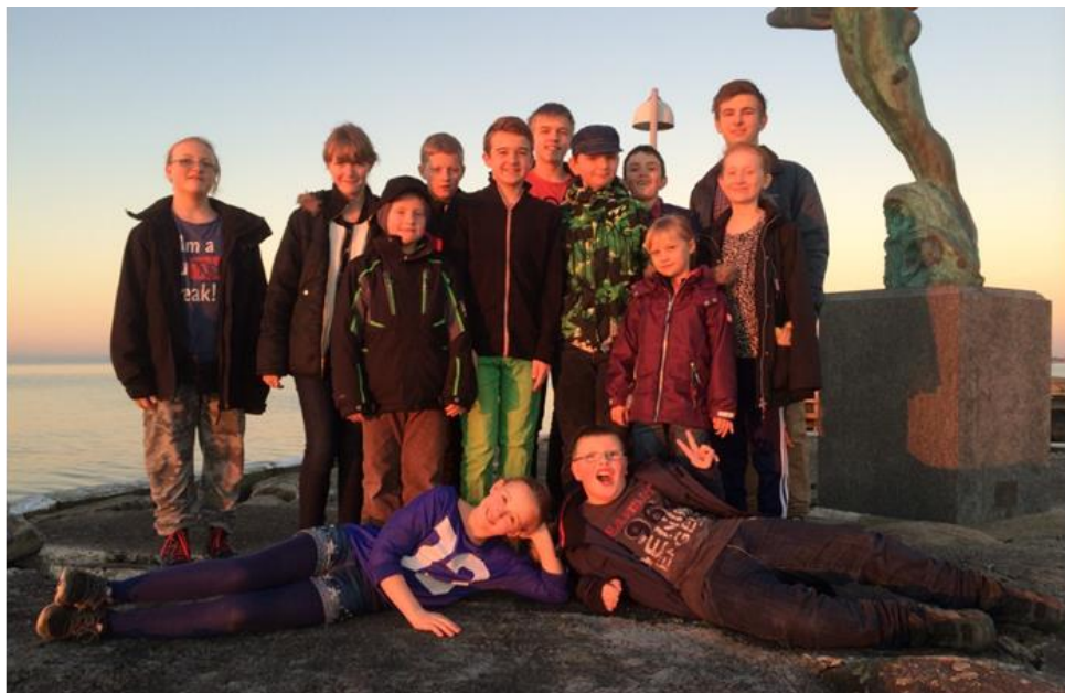
Næsten et år er gået siden vi stod her på molen – vi håber på en lige så god sejlersæson i år