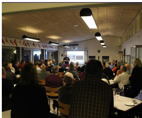
...og efterfølgende stillet mange spørgsmål