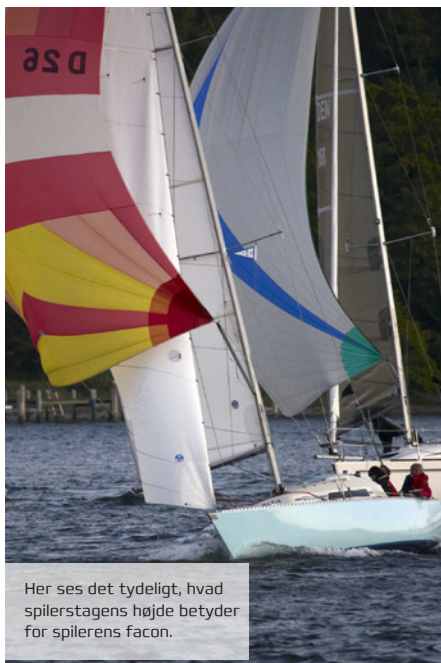
Her ses det tydeligt, hvad spilerstagens højde betyder for spilerens facon.

Stagen trimmes med nedhalerlinen, der altid bør være fæstnet til spilerstagen med en hanefod, der er monteret i begge stagens næb. Ophalet bruges til at hæve stagen, når spileren sættes og til at holde den oppe i let vind, hvor spileren ikke selv kan bære stagen.