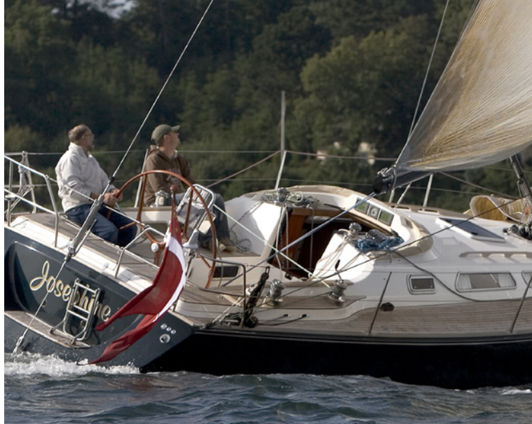
De fleste gennakere kræver ikke barberhal til tursejls, men flyver fint som på billedet. Hvis gennakeren har tendens til at blafre i toppen, er det dog en god idé med et barberhal.

Gennakerens skødepunkt trimmes med barberhalet på skødet, som du trimmer genuaens skødepunkt med skødevognen. Ved at hale barberhalet flyttes skødepunktet frem, og gennakerens agterlig lukker mere ved at blive "strammet op". Det skal du gøre, hvis toppen af agterliget har tendens til at blafre lidt og ikke trækker aktivt. Omvendt skal du passe på ikke at lukke agterliget for meget, for så krænger båden for meget.