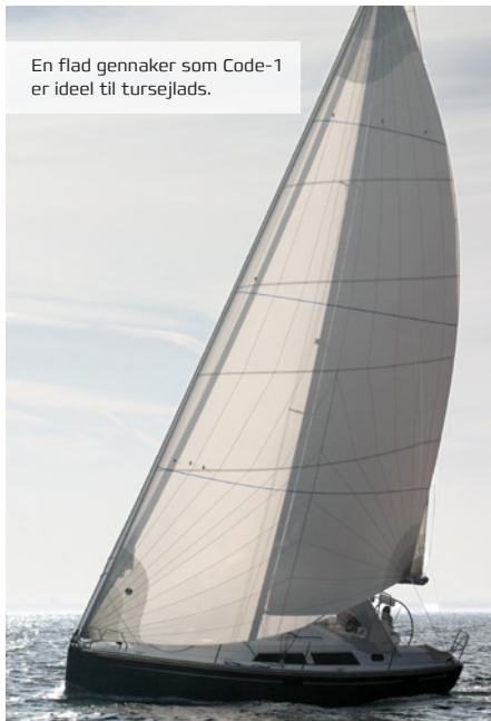
En flad gennaker som Code-1 er ideel til tursejlds.