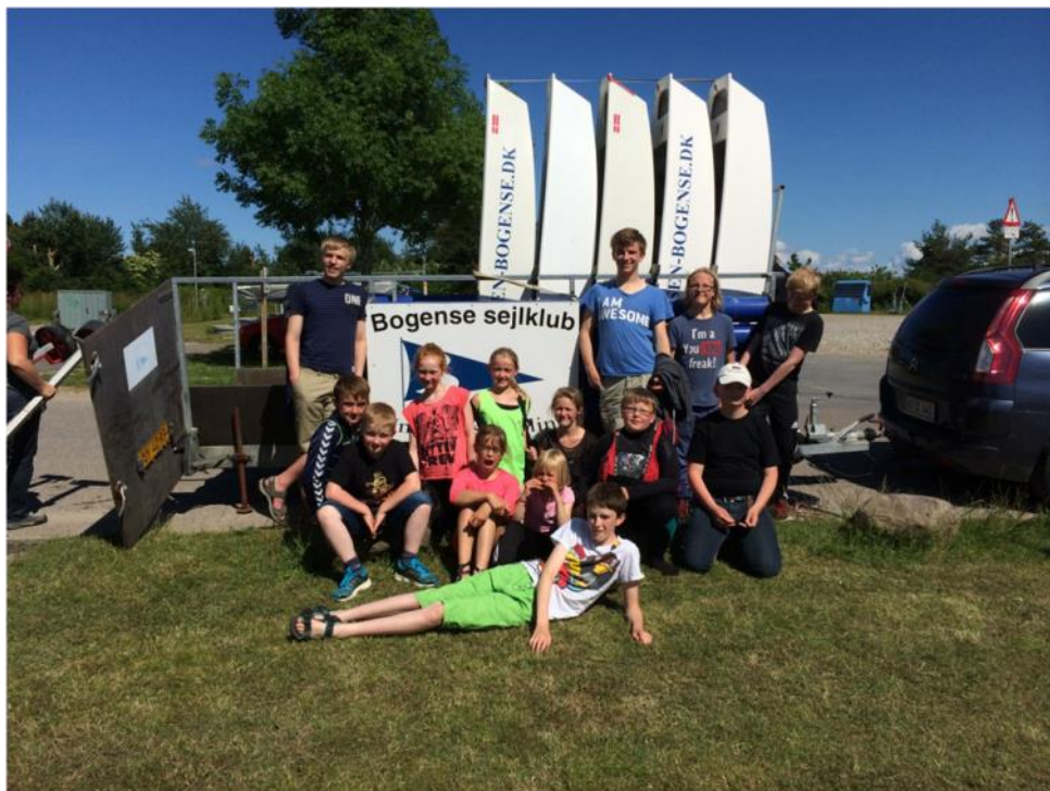
Holdet til Fænø rundt

trejde uge, hvor meningen var at fastholde det gode sociale samarbejde mellem sejlerne. Der blev indført, at der efter teorien skulle være fællesspisning, hvilket var med til at sørge for stor tilslutning.