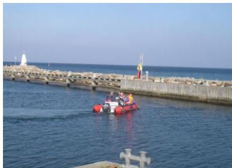
Havnemanøvre kan være svært

Alt sammen fordi vi som sejlkun kan have gavn af, at der kommer flere uddannede sejlere på vandet, hvad enten de sejler for sejl eller motor.