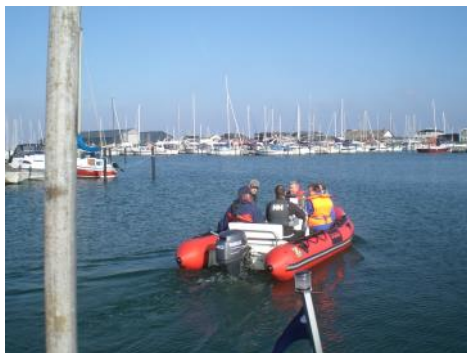
Sammen med censor sejler kursisterne ud til praktisk prøve

Efter morgenkaffe var der overhøring af speedbåds-kursisterne, og derefter startede prøverne i praktisk sejlads. 5-6 kursister sejlede ud med censor for at demon-