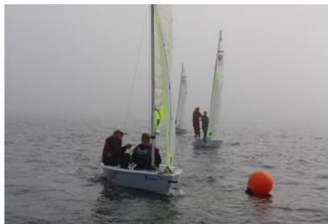
Runding af topmærke, det er svært at se tilbage til startlinjen for tågen

Om aftenen var der stor fællesspisning med tre retters menu, hvilket skabte en rigtig god stemning blandt sejlere og forældre.