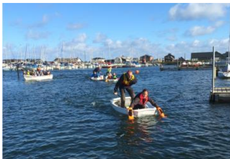
Det er hårdt at padle om kap, så pulsen kom op og det store smil blev fundet frem

Næste år vil vi have fokus på at blive ved med at have et godt miljø, hvor sejlerne har lyst til at være, og derfra vil vi se hvad det er for aktiviteter, sejlerne ønsker, - om det er hyggesejlads med fokus på enkelte