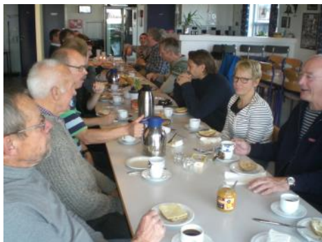
Fælles morgenkaffe på prøvedagen

Der kom 31 tilmeldinger. Fuldstændig overvældende. Der kunne kun optages 16 kursister, så resten fik tilbud om at komme på et kursus i foråret.