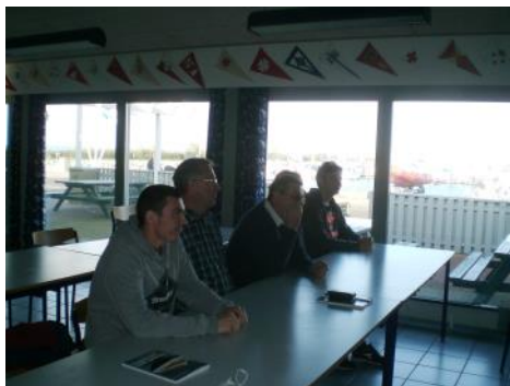
Nervøse kursister til overhøring

Den ene dag med praktisk sejlads blæste det 10 m/s fra vest, så det var umuligt at komme udenfor havnen. Derfor foregik alle manøvrer i det yderste havnebassin (undskyld til de, der blev generet herved).