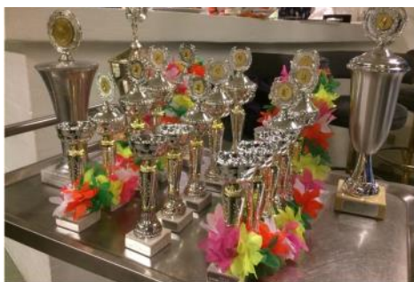
I år var der mange pokaler at dele ud

Midt i september afholdt vi klubmesterskab i ungdomsafdelingen, som var en kæmpe succes. Da vi mødte ind lørdag