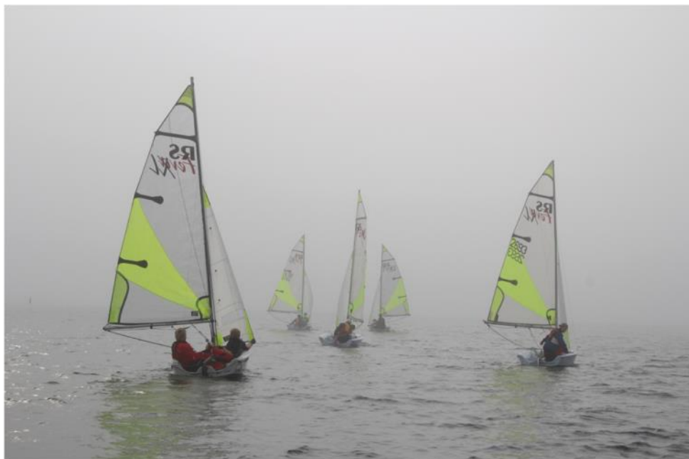
Lænseben fra topmærke, mållinjen kan skimtes yderst til venstre

denne gang i Middelfart. Det gav gode timer på vandet, som kunne ses i den efterfølgende træning.