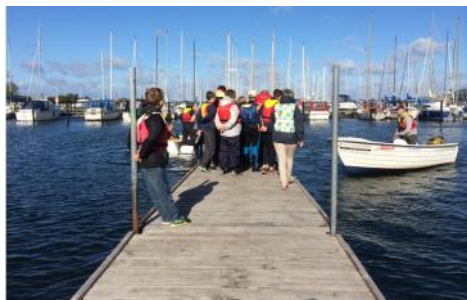
Stor tilslutning til årets JumboCup, her ses forældre som ikke skulle padle i første omgang gøre klar til at heppe på deres holdkammerater

detaljer, eller om det er en mere kapsejladningsorienteret retning.