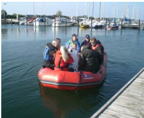
Endnu et hold kommer i havn efter bestået prøve

Lige nu planlægges et tættere samarbejde mellem Speedbådskørekort og Sejlerskolen. Da bestået Speedbådskørekort